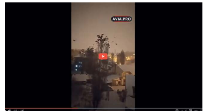
I Tyrkiet blev der observeret en mærkelig adfærd hos fugle lige før jordskælv, LINK

Som altid fortæller videooptagelser og fotos i nedenstående indlæg en historie, som kun kan formidles gennem billederne. For eksempel forsøgte de store flokke af oprevne fugle i videoen klart at fortælle den lokale befolkning, at der er noget meget galt. Ja, dyr opfører sig altid mærkeligt og forlader området før en jordskælv, men måske blev disse fugle påvirket negativt af et superenergi våben lige inden disse 2 store jordskælv i Tyrkiet..